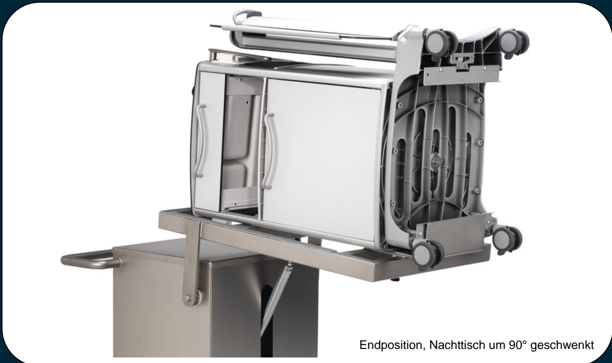
Endposition, Nachttisch um 90° geschwenkt

Per Knopfdruck wird der Nachttisch dann geschwenkt. Dabei kann der Nachttischwender in jeder Position bis zu 90° angehalten werden, so dass für jede Bedienperson die ergonomisch beste Arbeitsposition gefunden werden kann.